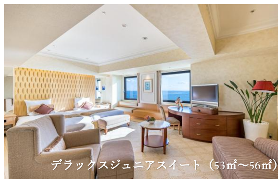
デラックスジュニアスイート (53㎡~56㎡)