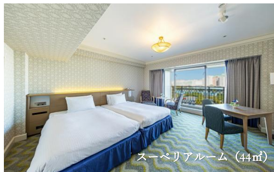
スーペリアルーム (44㎡)